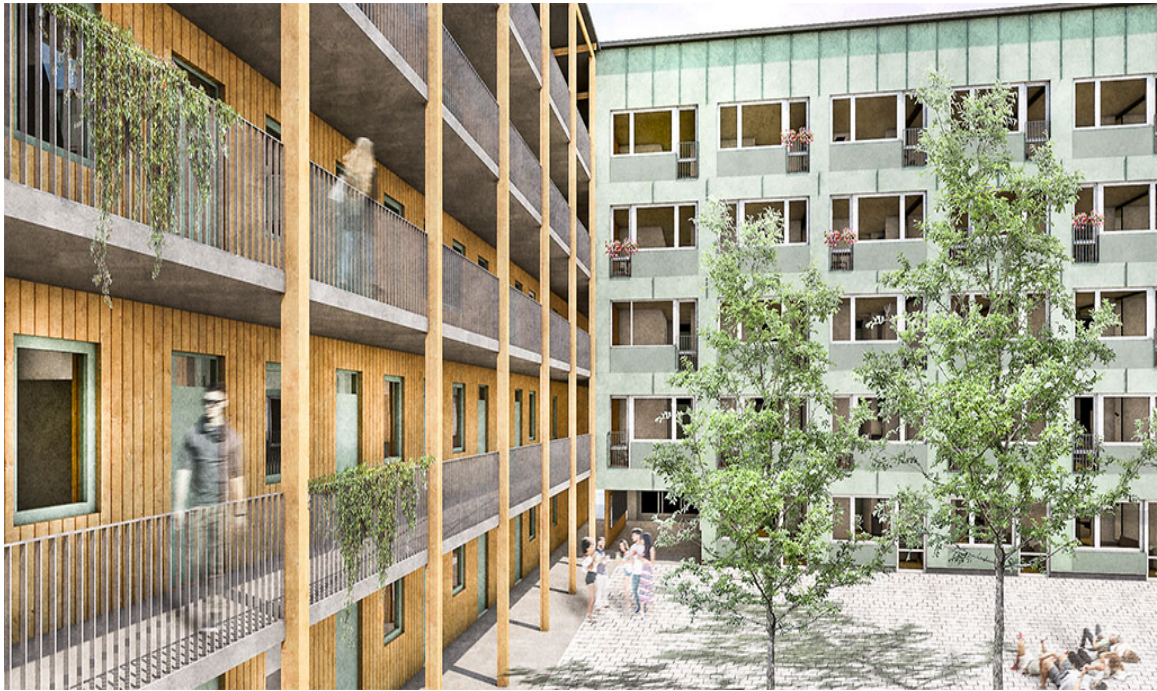
Visionsbild nybyggnation och torg/förgård