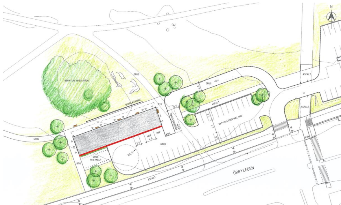
Funktionshuset. Den röda linjen är den tänkta konstväggen, som främst är synlig från söder och sydost. (AIX Arkitekter/AJ Landskap)