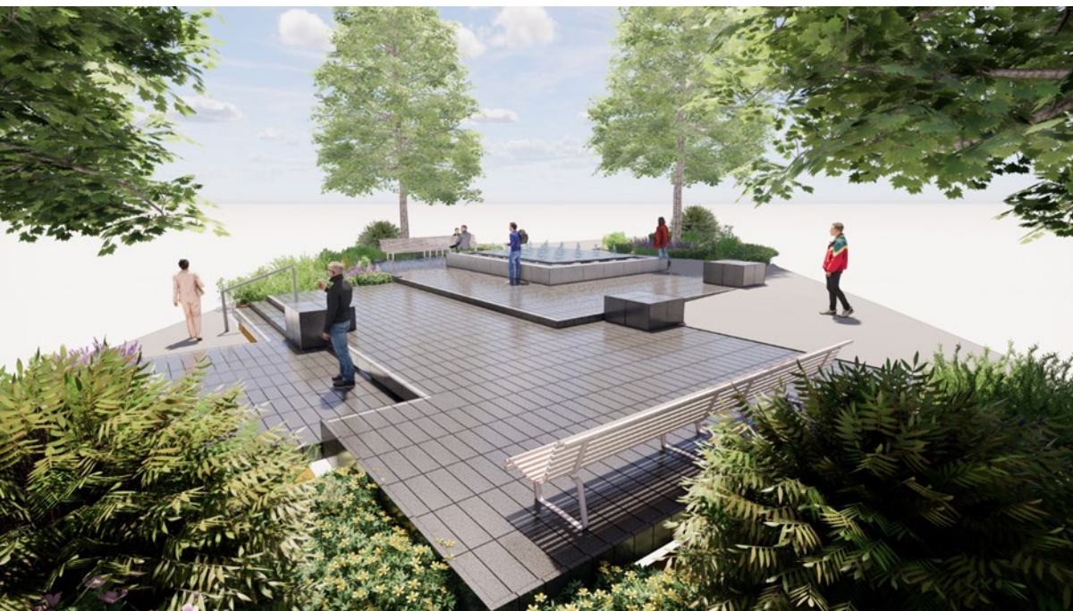
Möjliga platser för konsten är Parktorgets tre sittytter, som är gjorda av röd Bohusgranit. Bild: Andersson Jönsson Landskapsarkitekter AB