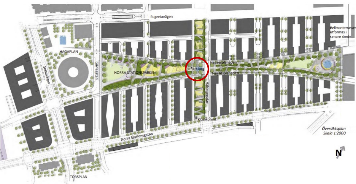
Parktorget ligger i Norra Stationsparkens mitt och kommer att bli en visuell nod i området.