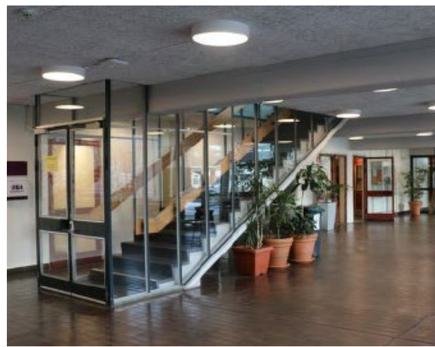
Bilden till vänster visar konst som finns på skolan och som är karaktäristisk för 1960-talet, bland annat "Skärmarna", en skulpturgrupp i betong på gården framför entrén samt en väggrelief i förbindelsegången som är gjord av Stefan Thorén. Bilden till höger visar uppehållsrummet och trapphuset, som det ser ut idag.

Konstnären behöver förhålla sig till vissa praktiska förutsättningar. Exakta placeringar av konsten ska därför beslutas i samråd med arkitekt, konstprojektledare och verksamheten. Ytterligare parametrar att förhålla sig till är tillgänglighetskrav och antikvariens förundersökning.