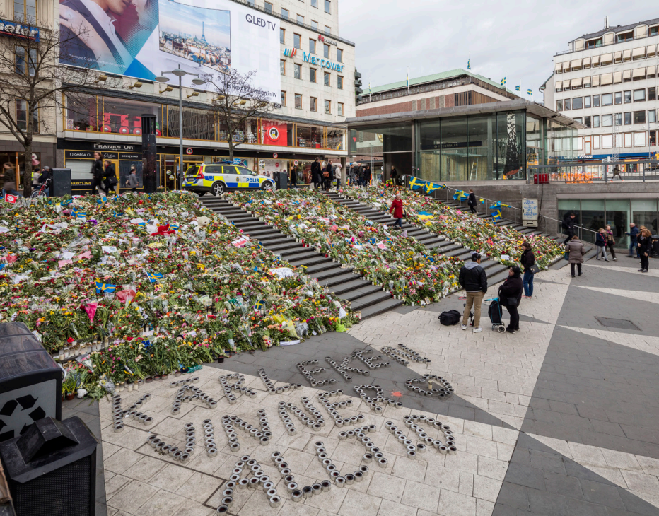
Dagarna efter dådet användes trappan som går från Drottninggatan och ner till Sergels torg som en blomstrande minnes- och manifstationsplats.