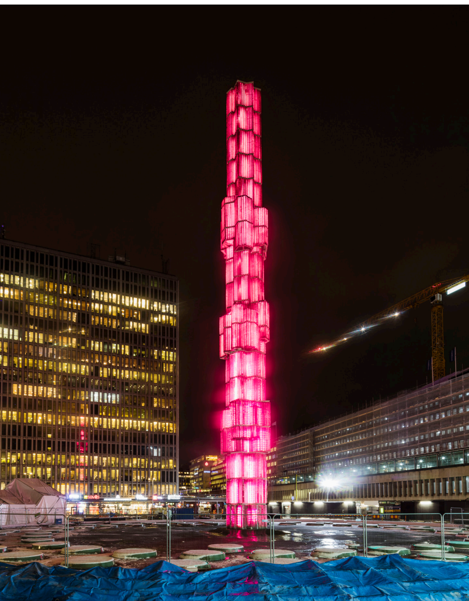
Kristall – Vertikal accent i glas och stål (1974) är ett verk av Edvin Öhrström. Hösten 2017 renoverades glasobelisken, vilket innebar att 60 000 glasprismor plockades ner och rengjordes. I samband med denna renovering ersattes belysningen. Numera skiftar obelisken färg efter årstid: varma toner på vinterhalvåret och mer kalla, som grönt och blått, på sommaren.