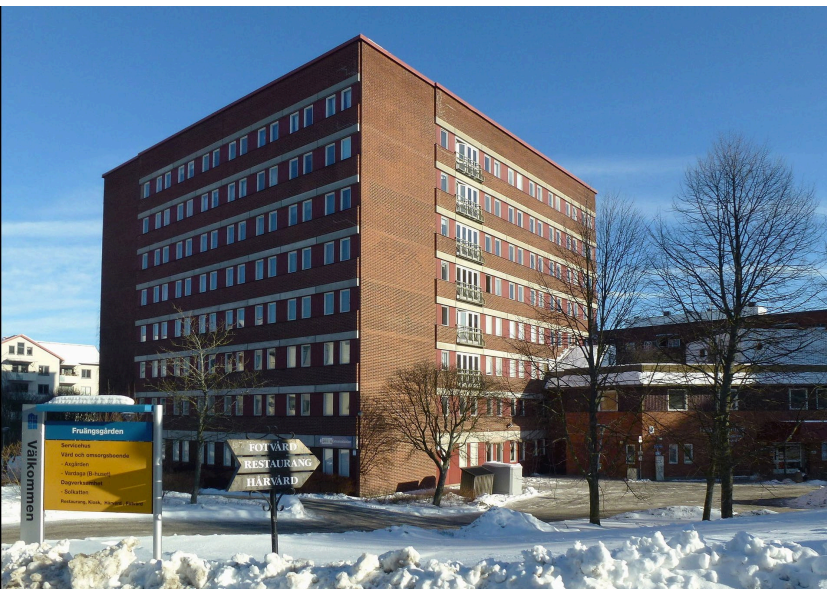
Hus A sedd från Gamla Södertäljevägen. Ny huvudentré placeras på kortsidan.