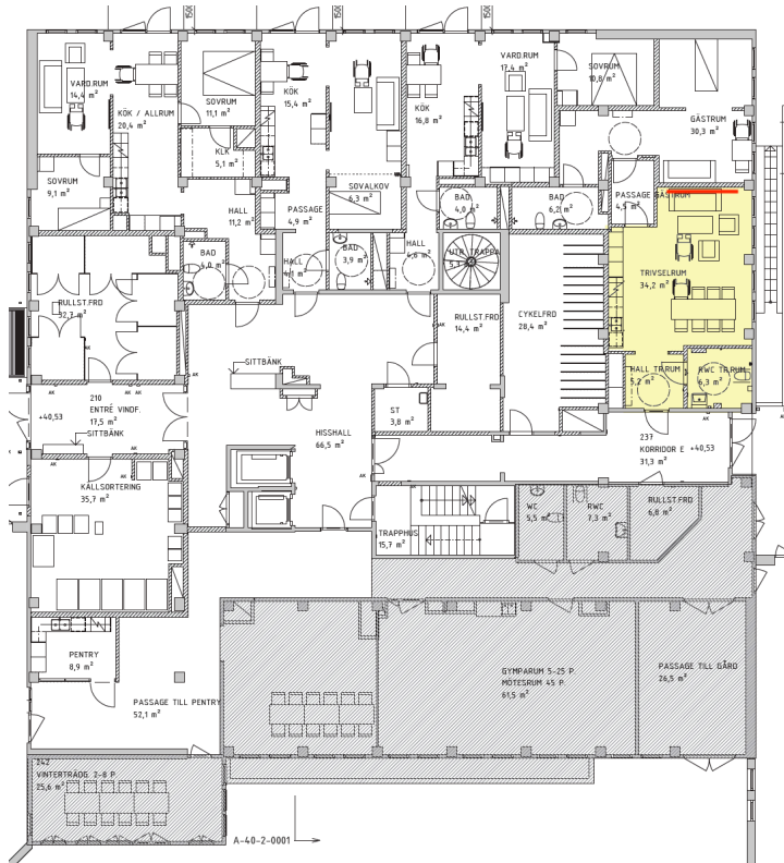
Trivselrummet på entréplan. Den röda linjen visar platsen för konsten.