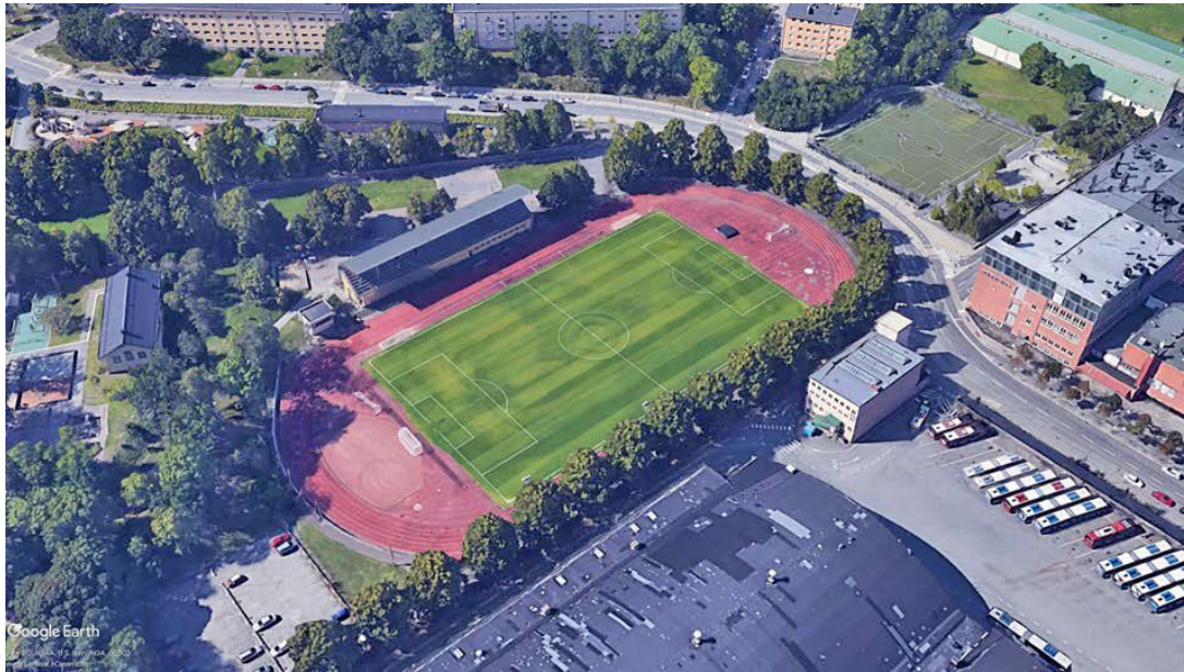
Den nuvarande idrottsanläggningen i Kristineberg är ritad av Paul Hedqvist.

Kristinebergs idrottsplats är klassad som en ”fastighet med bebyggelse som är särskilt värdefull från historisk, kulturhistorisk, miljömässig eller konstnärlig synpunkt”. Förutom de kulturhistoriska, arkitektoniska och övriga värden beskrivs även ett kontinuitetsvärde; anläggningen berättar om en gryende idrottsrörelse och en plats som med tiden fått en delvis förändrad funktion.