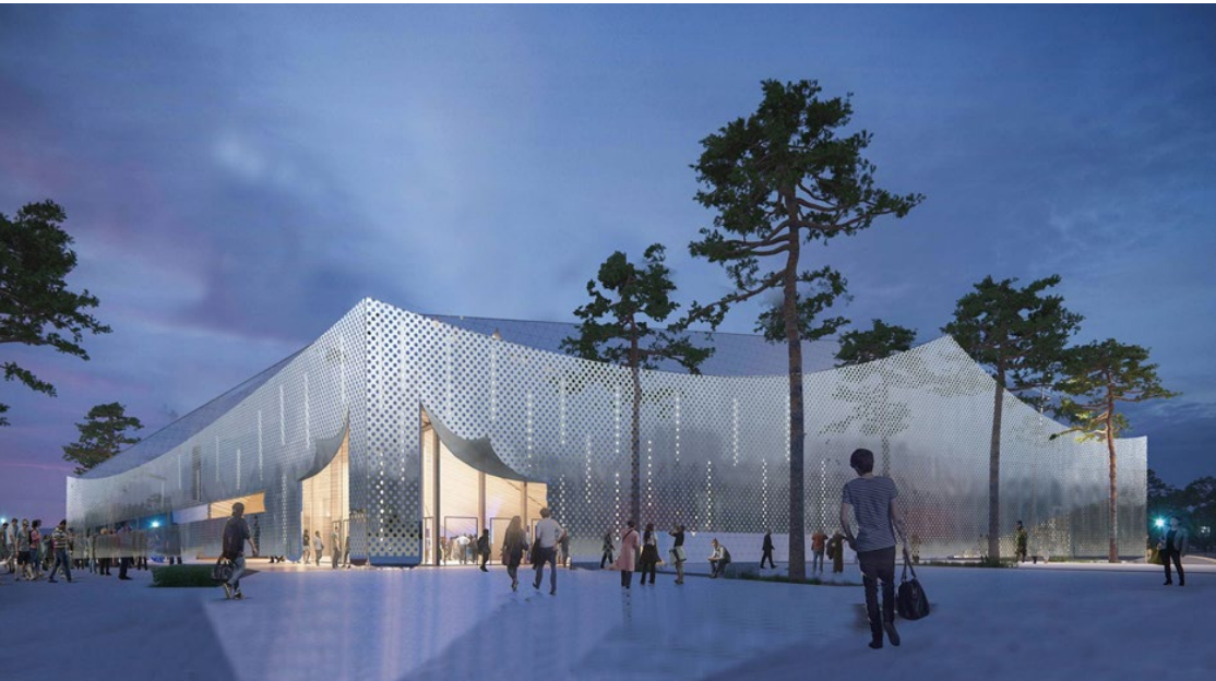
Arkitekternas vision av den nya ishallen. MAF arkitekter.