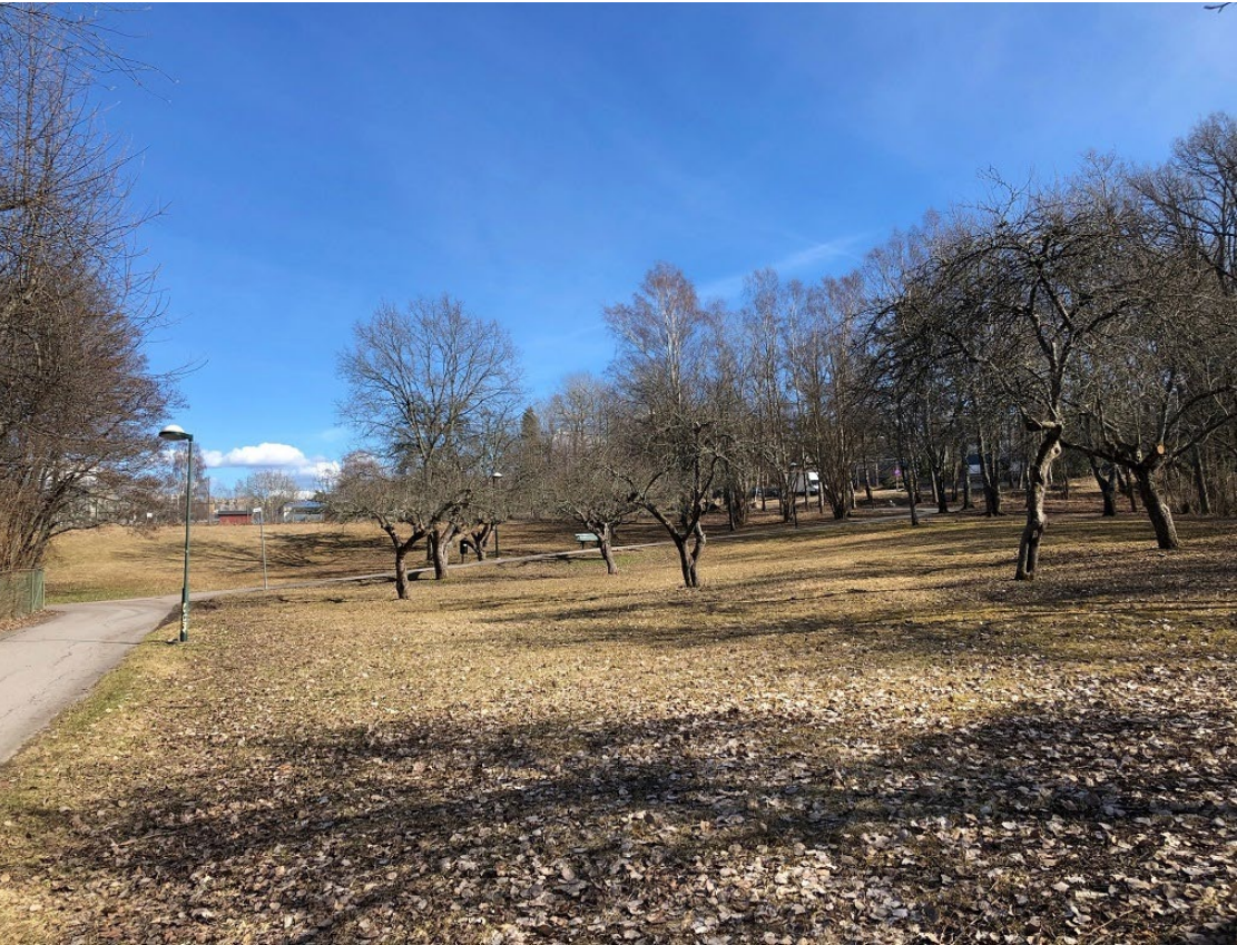
Johannesdalsparken – platsen för gestaltungsoppdraget.