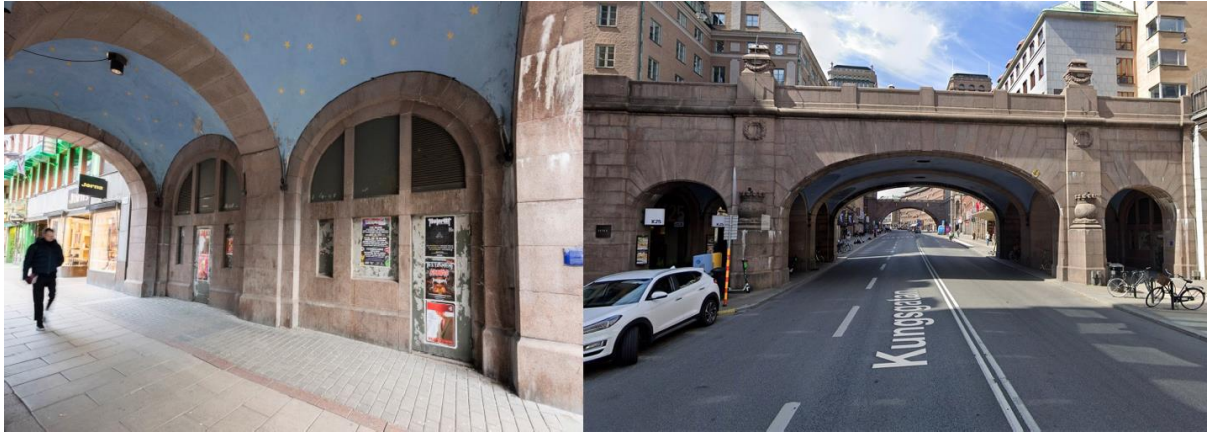
Regeringsgatans bro och brovalv över Kungsgatan.