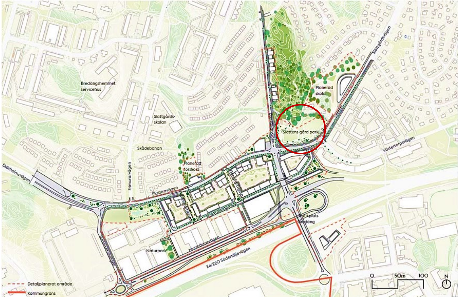
Situationsplan över Slättens gårds park.