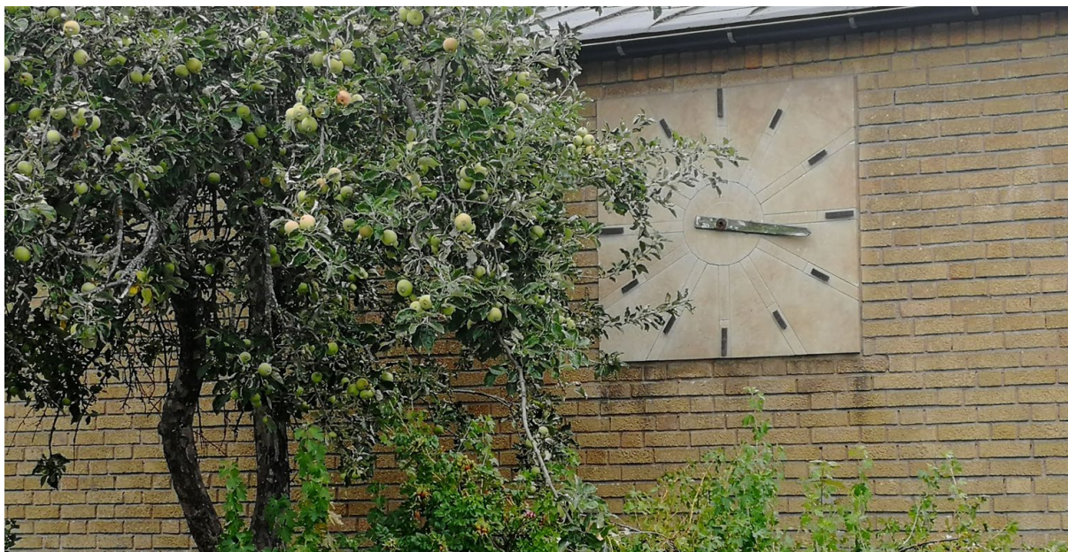
Detalj från Sundbyskolans fasad.

Skolan hyser en målgrupp för konst som är mellan 6–16 år, från barn till tonåring. Att skapa ett verk på en plats som känns angeläget för målgruppen som helhet är snudd på omöjligt. Frågan uppstår om det med ett annat angreppssätt går att förenkla uppgiften, till exempel genom att arbeta med flera mindre verk på olika platser. På så vis får konstnären möjlighet att tydligare rikta verk på respektive plats till respektive målgrupp. Flera mindre verk på flera platser rymmer dessutom en annan tolkning som mer har att göra med dagens syn på inläring, källkritik, mångkultur etc. Ett verk på en officiell plats kan riskera att uppfattas som ett monument vilket inte är attraktivt i detta sammanhang, varken i relation till platsens kärnverksamhet eller till det platspecifika ur ett gestaltningsperspektiv.