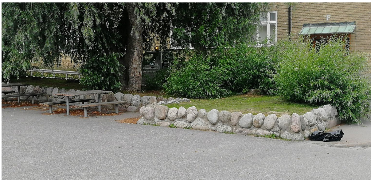
Hängplatsen är en av de föreslagna, befintliga platserna i konstprogrammet. Här vistas elever i åk 7–9. Denna plats kommer att byggas om.