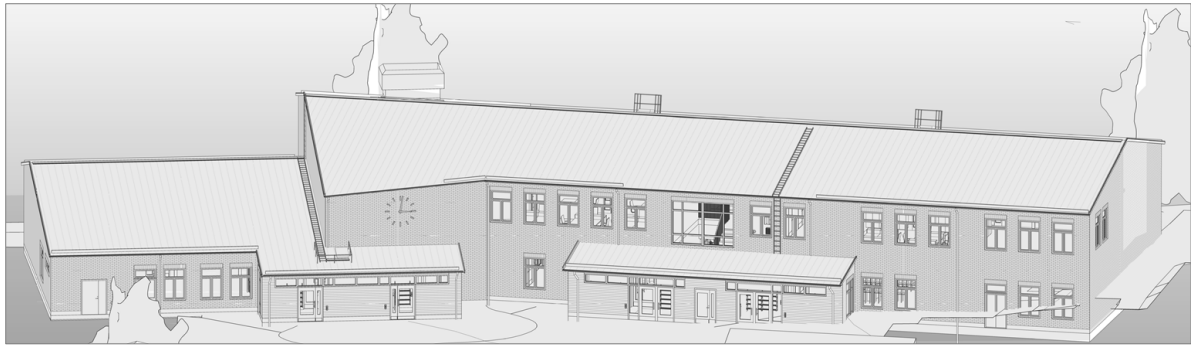
Ett av de nybyggda husen, hus T, sedd inifrån skolgården.