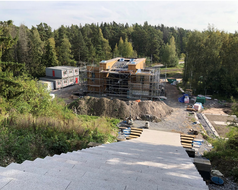
Trappan sedd uppifrån och nerifrån under byggnation vår 2023.