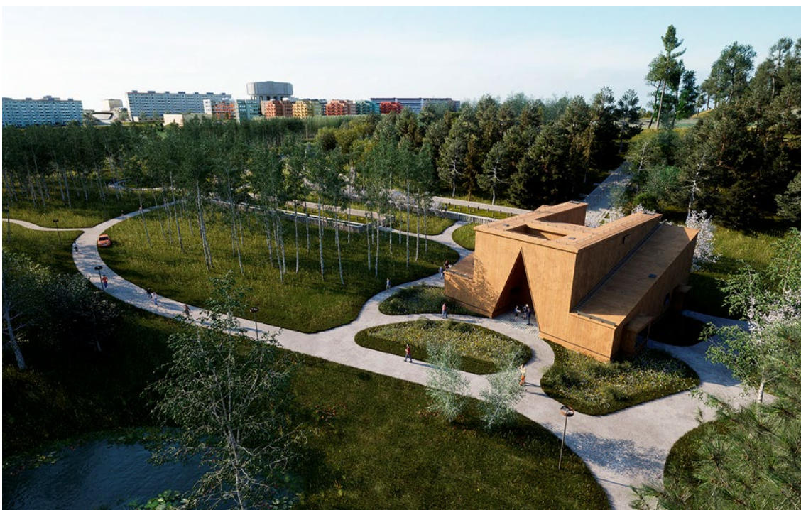
Ceremonibyggnaden med den karaktäristiska triangelformade entrén och den långa trappan upp mot åsen i bakgrunden.

På platsen finns en ceremonibyggnad och intill den en lång trappa som leder upp till åsen. Planen för åsen är att skapa en andra etapp av begravningsplatsen och trappan blir en enkel väg mellan de två delarna. Formelementen i byggnaden består i huvudsak av de grundläggande geometriska strukturerna. Kvadraten (rektangeln), triangeln och cirkeln framstår som en hyllning till det skenbart enkla och utgör en sorts lakonisk motpol till det omgivande områdets organiska skepnad.