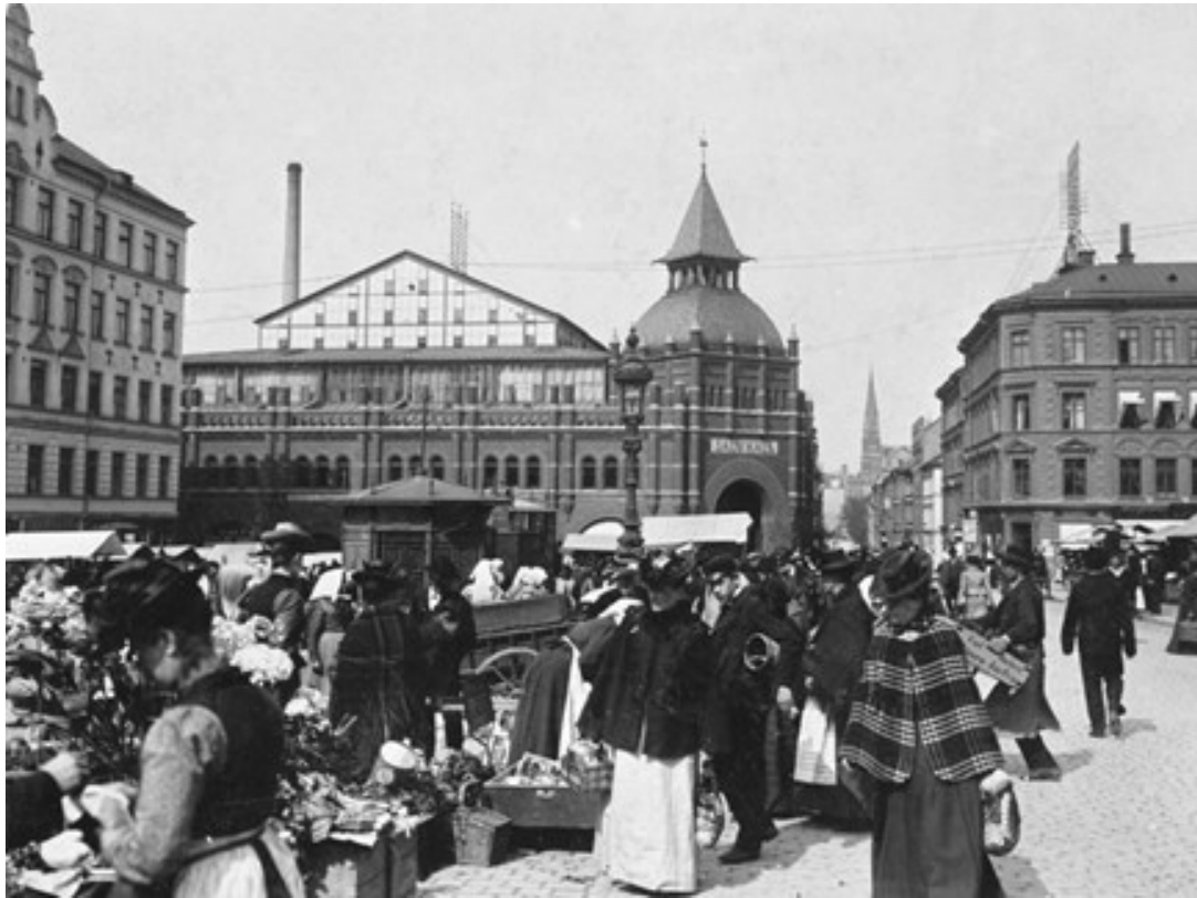
Torghandel på Ladugårdslandstorget (numera Östermalmstorg).