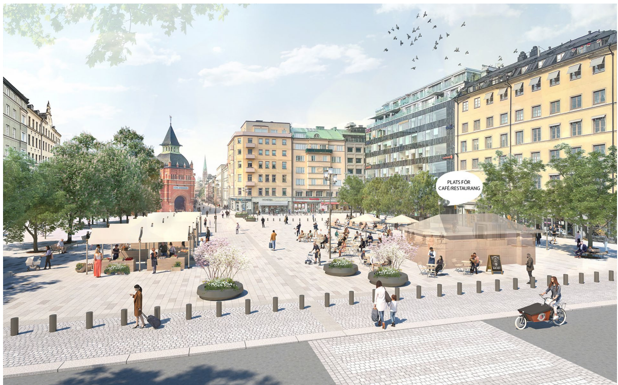
Östermalmstorgs nya gestaltning. Rendering: Karavan arkitekter.

I nordost, mot Sibyllegatan, byggs en restaurangbyggnad med uteservering. Den befintliga Östermalmsgrillen tas bort, men möjlighet till en framtida mindre kiosk i samma läge kommer att finnas kvar. Torghandeln ges gott om utrymme och belysningen för hela torget blir ny i form av en mer finstämd belysning med belysningsstolpar i två olika höjder. Även Storgatan rustas upp med nya träd, beläggning, bänkar och belysning.