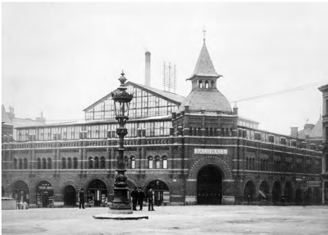
Den nyuppförda saluhallen i hörnan Nybrogatan och Humlegårdsgatan, år 1889.