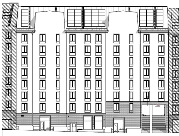
Utsnitt av fasad med portik och pelare mot gatan. Fasadritning Brunnberg & Forshed.

Portiken har som mest drygt 7 meter i takhöjd och trappan kommer att utföras i granit. Taket i portiken bärs upp av två pelare i betong. Den mot gatan är 600 i diameter och den mot gården är 400 i diameter. Av tillgänglighetsskäl kan någon del av pelarna behöva markeras för synlighet. I trappan finns ledstänger på 0,9 m höjd över trappa. Handledarna fästs i trappan. I mitten av trappen finns en barnvagnsramp, även den med handledare på vardera sidan. Sopnedkast för hyresgästerna kommer att finnas inne i portikens övre del mot gården. Taket och pelarna är platser för en konstnärlig gestaltning. En möjlighet är att bearbeta pelarna tredimensionellt och taket med ljus.