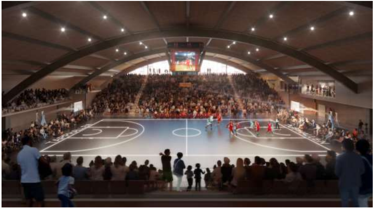
Visualisering av idrottshallen. White Arkitekter