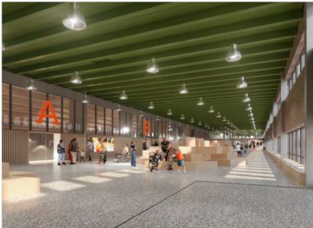
Visualiseringen av idrottscentrets entréhall med uppehållsytor. White Arkitekter