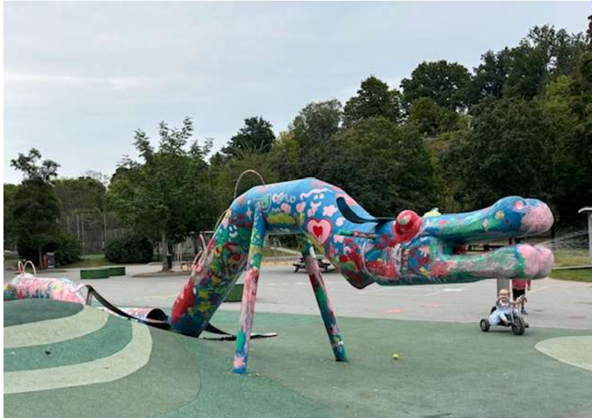
Draken i parkleken av konstnären Ulf Sucksdorff.