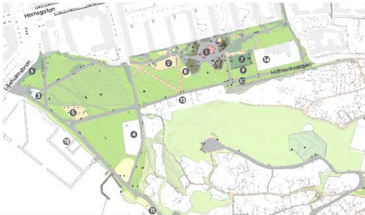
Drakenbergsparken 1. Parklek, 2. Stadsodling, 3. Servering, 4. Bangolf, 5. Utegy, 6. Graffitivägg, 7. Bollplan, 8. Vollybollplan, 9. Skateyta, 10. Hundrastgård, 11. Strandbad, 12. Småbåtshamn samt dagvattenanläggning, 13. Tantos koloniområde, 14. Förskola. Illustration: Stockholm stad