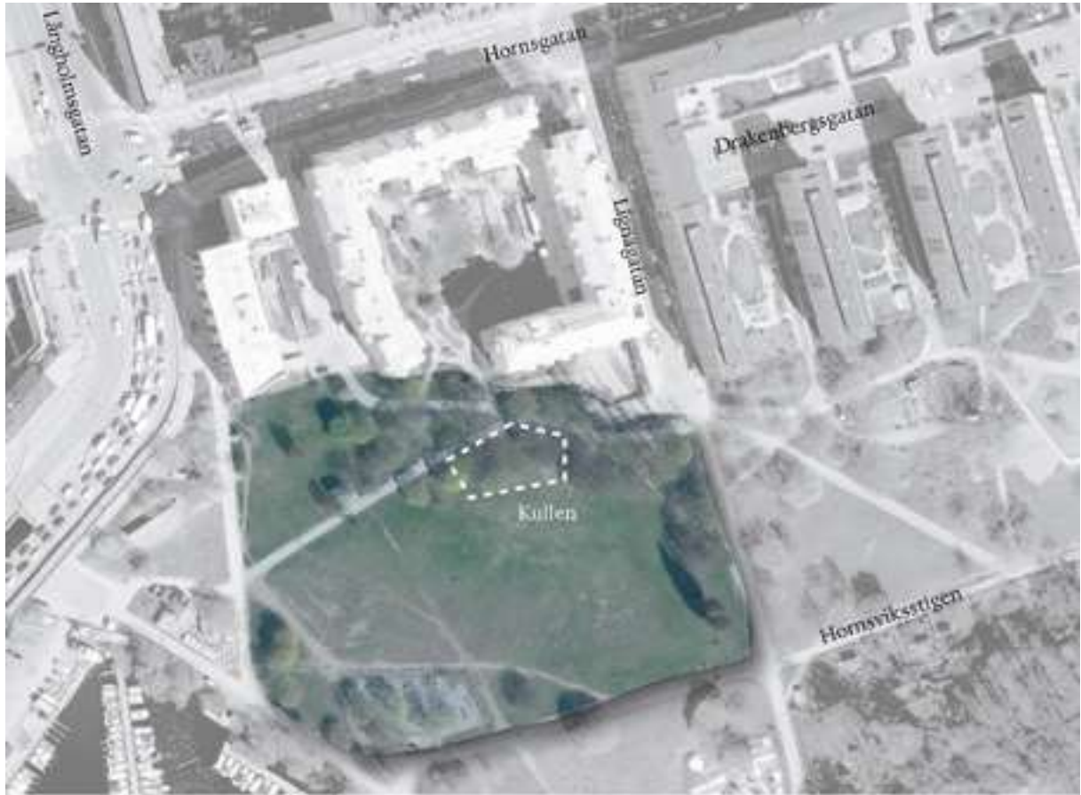
Karta över del av Drakenbergsparken, plats för konst – kullen - markerad i vitt. Ortofoto ©Lantmäteriet