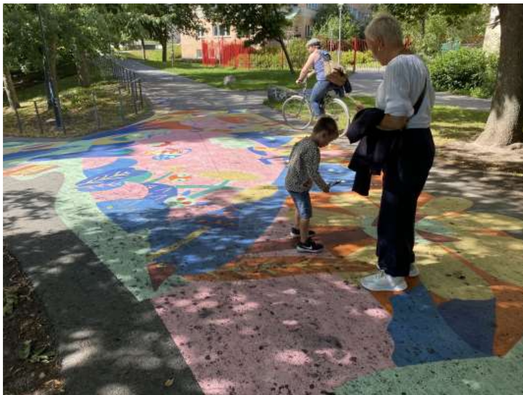
Del av gatumålningen i riktning mot Hornstull. I övre delen av bilden skimtar Christian Partos konstnärliga gestaltning, det röda staketet, för Hornstulls servicehus. Kullen ligger till vänster utom bild.

Drakenbergsområdet, med park och bostäder, anlades i slutet av 1960- och början av 1970-talen. Ett av flera exempel på miljonprogramsområde mitt inne i staden. I och med att området danades om försvann också Ligna industriområde som legat på platsen sedan 1800-talet. Namnet Drakenberg är ett kvartersnamn som ursprungligen kommer från en krog vid namn Draken som verkade och frodades vid mitten av 1600-talet.