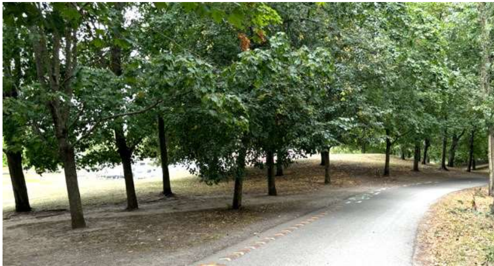
Barnens berättelser på gångstråket, kullen skymtar bakom träden till vänster.