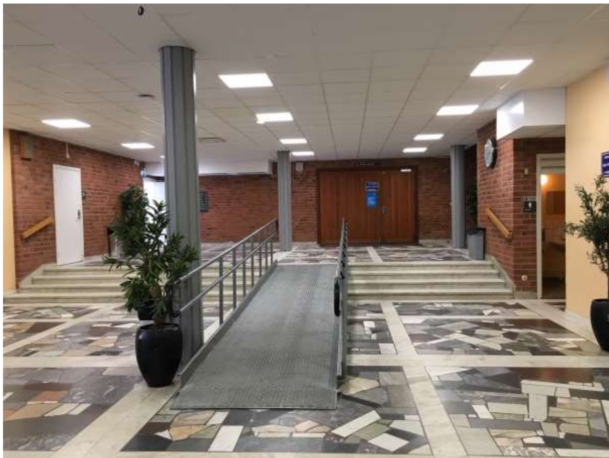
Entréhallen på plan två med ursprungligt stenmosaikgolv. Rampen kommer att tas bort.

Entréhallen på plan tre är idag en öppen yta med ett fåtal sittplatser på kortsidan med fönster mot Tellusborgsvägen. Det är en yta som används av skolornas elever och även som uppehållsyta under raster men också som väntplats för idrottsutövare. Hallen har bra ljusinsläpp genom det stora fönsterpartiet och från kupollanterner. I den framtida hallen planeras taket att ersättas med ett nytt undertak av träribbor. Det ursprungliga karaktäristiska mosaikgolvet kommer att restaureras och plan finns för att även ersätta de gråa partierna med ett golv som går linje med det mosaikmönstrade. På dessa gråa ytor kan en konstnärlig gestaltning ta plats. Gestaltningen bör samspela med det ursprungliga golvet och hämta inspiration från det, men ändå särskilja sig på ett tydligt men likväl harmoniskt sätt. Möjlighet att integrera sittytter i gestaltningen finns och dessa bör hitta ett sätt att följa rummets form och siktlinjer.