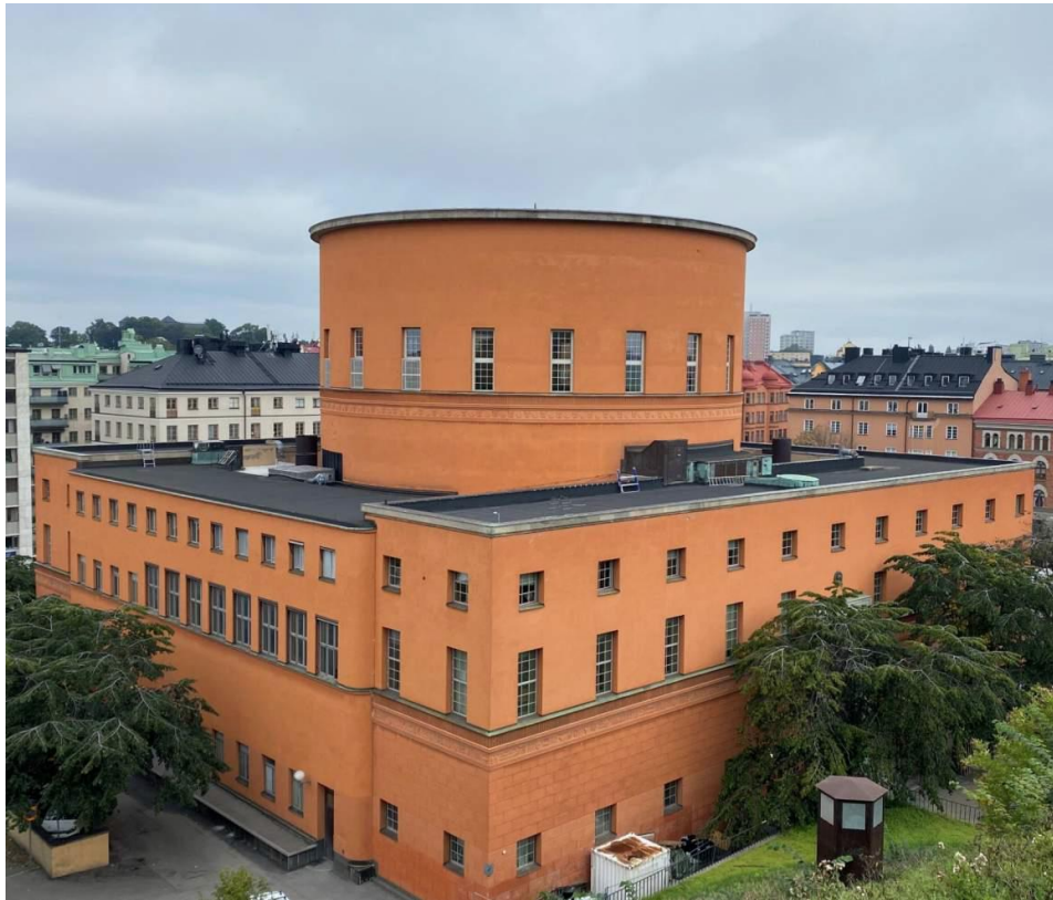
Stockholms stadsbibliotek i Vasastan. Vy från Observatorielunden.