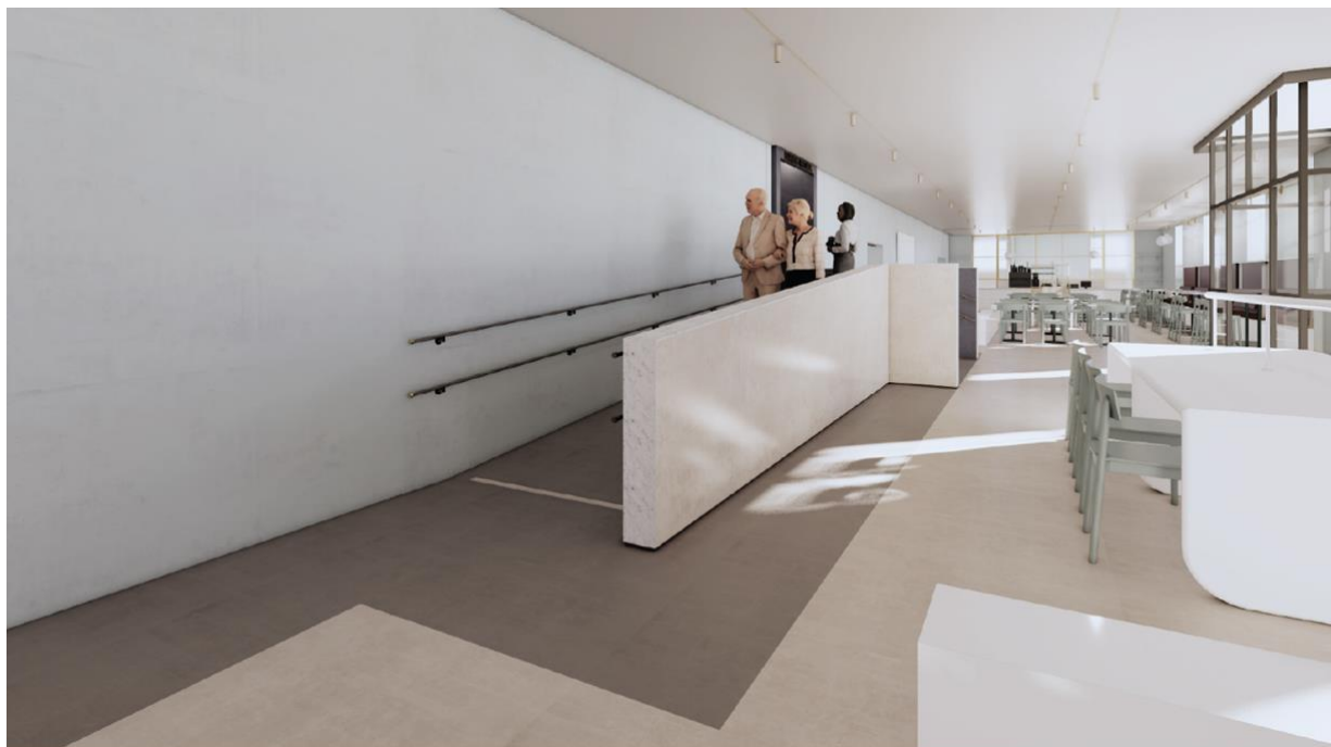
Ingången till Barnens rotunda från entrérummet mot Odengatan. Bild: Arkitema.