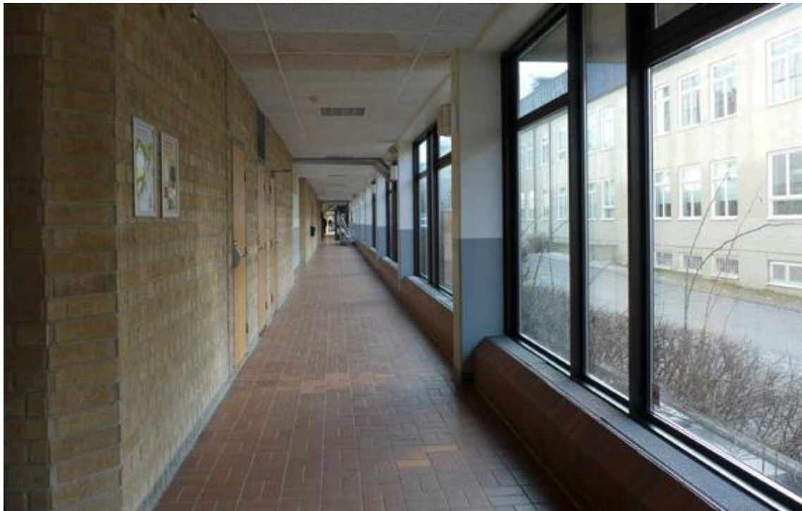
Den norra korridoren som gränsar till omklädningsrum och stråket utanför.