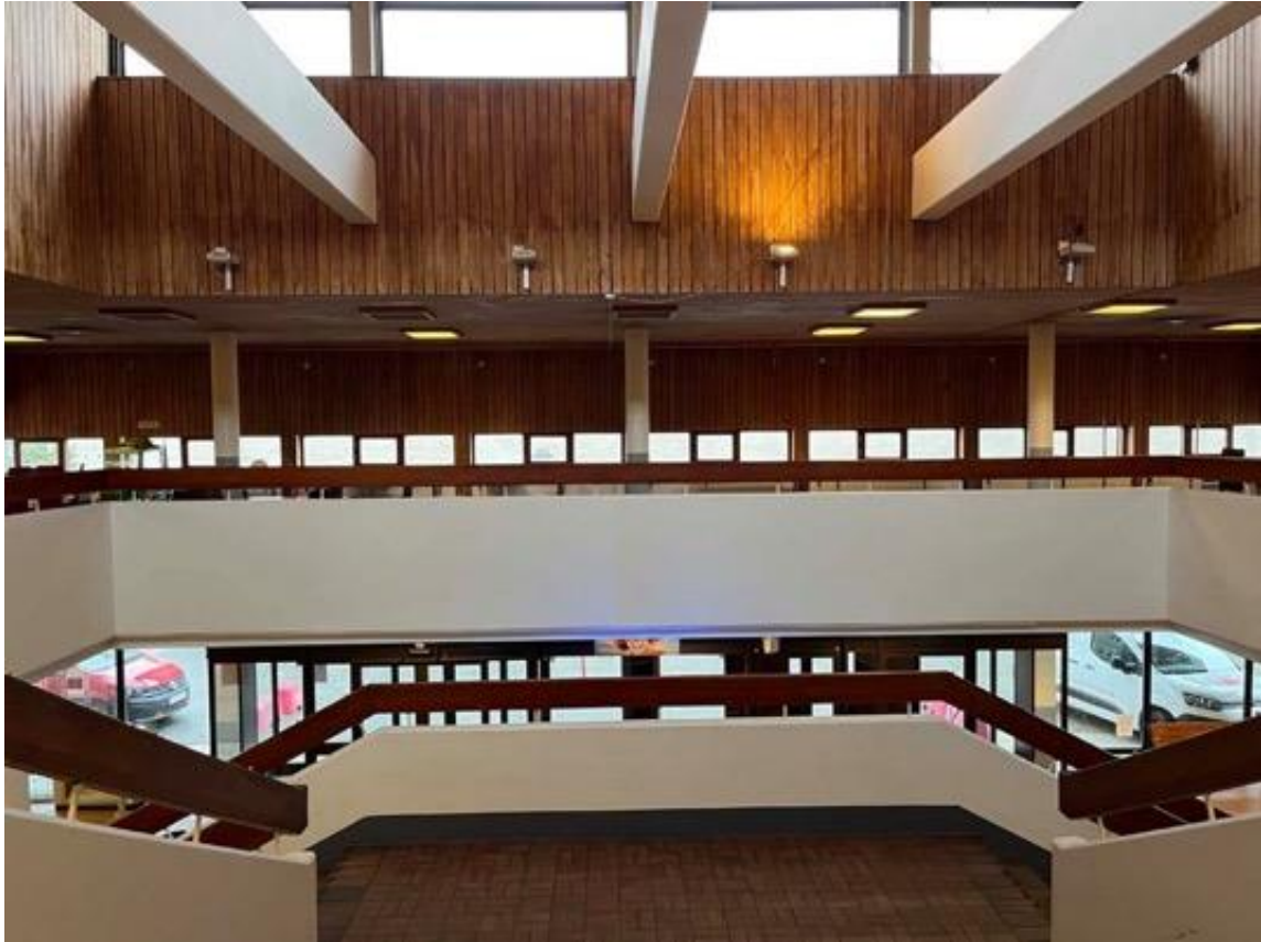
Entréhallens trappa och taklanternin.