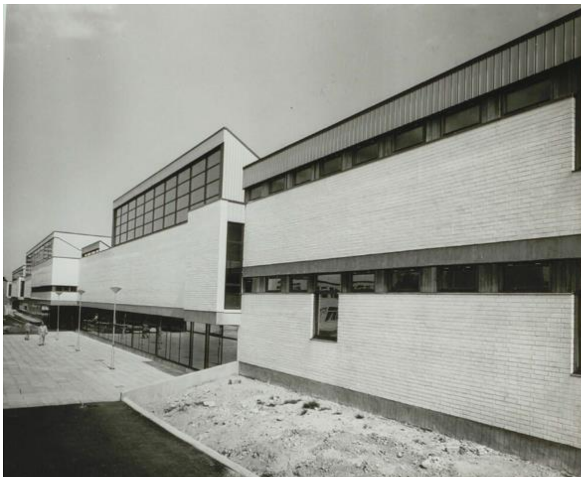
Sim- och idrottshallen när den var nyuppförd på 1970-talet.

I tidens anda uppfördes sim- och idrottshallen som en solitär byggnad med stark skulptural karaktär – ett spel med täta volymer, långa fönsterband, stora glaspartier och lanterniner. En byggnad av dignitet som fogades till andra i Vällingby såsom biblioteket, biografen Fontänen, medborgarhuset Trappan, de två kyrkorna S:t Tomas kyrka och Västerorts kyrkan.