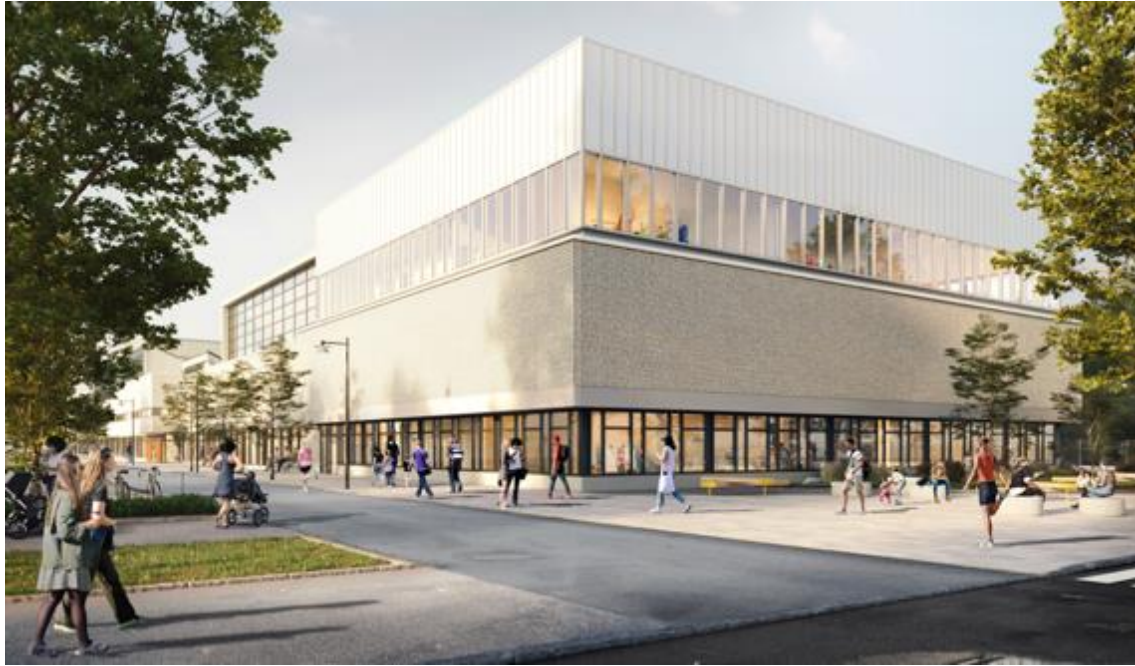
Fasad mot söder. Illustration: Liljewall arkitekter.