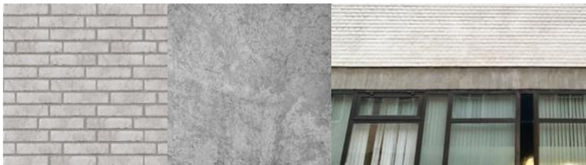
Material utvändigt – tegel, betong, metallpartier.

Vällingby sim- och idrottshall ska nu renoveras och byggas om och för att möta dagens olika krav blir renovering och ombyggnad omfattande. Byggnaden kommer att behöva rivas till stomrent och förses med nya ytskikt både in- och utvändigt. En återbruksinventering kommer att göras för att se över vilka material och andra delar som kan återanvändas. Bevarandeambitionen är hög och tillägg görs i samklang med befintlig arkitektur. En ny huskropp, husvolymen mot söder och Vällingby centrum, utformas omsorgsfullt och i dialog med befintlig gestaltning. Den ges ett mer öppet uttryck än dagens mer slutna volym. Den utvändiga materialpaletten bibehålls: ljust tegel, synlig betong, glas, teak, varmvit plåt och bruneloxerad aluminium.