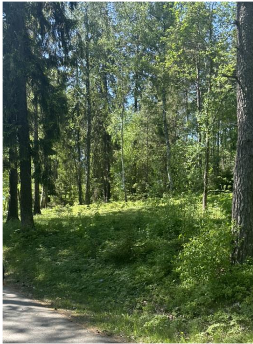
Platsen som den såg ut våren 2024.