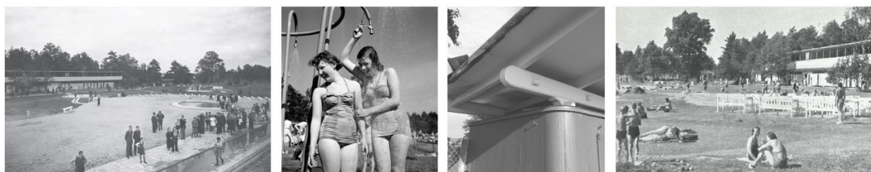
Äldre foton från Antikvarisk förundersökning 2015-09-23 av AIX-arkitekter.